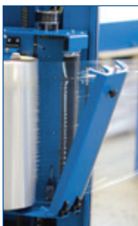
NEUER TÜRKLAPPMECHANISMUS in allen Modellen